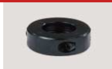
Ablaufsicherung Safety device bague de sécurité

Technische Änderungen vorbehalten Technical alteration reserved Toutes modifications réservées