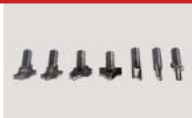
Satz Profilfräser, 7 Stck. set of profile cutters, 7 items outils de fraise, 7 pieces