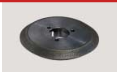
Diamantschleifscheibe für Profilschleifmaschine / diamond grinding wheel for profile sharpening machine / meule de forme en diamant pour machine à affûter pour outils