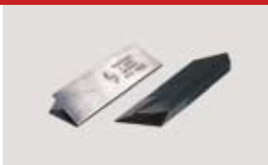
Kopierdrehstähle (V-Form) profile cutters (V form) outils de copiage en V