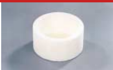
Topfschleifscheibe für WEMA Blitz cup grinding wheel for WEMA Blitz meule à aiguiser pour WEMA Blitz