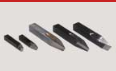
Kopierdrehstähle (spitz) profile cutters (pointed) outils de copiage pointu