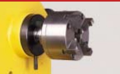
Vierbackenfutter Four jaw chuck Mandrin à quatre mors