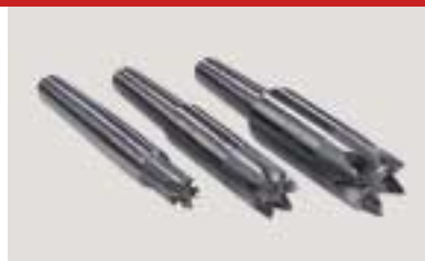
Sechszackmitnehmer, verlängert Six pronged dog extended Entraîneur à six dents long