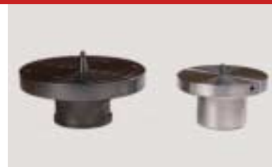
Planscheibe D 200+300 mm face plate d 200+300 mm Plateau d 200+300 mm Scheibenfutter D 90 mm disk chuck d 90 mm mandrin à disque d 90 mm