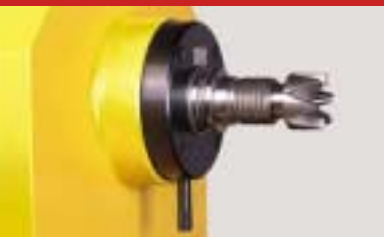
Sechszackmitnehmer kurz six pronged dog short Entraîneur à six dents court