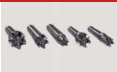
Sechszackmitnehmer kurz, verschiedene Durchmesser six pronged dog short, diff. diameter Entraîneur à six dents court, dif. diametre