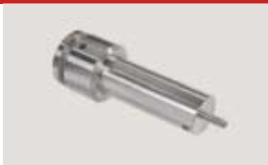
Scheibenfutter verlängert D 45 mm disk chuck long d 45 mm Mandrin à disque de d 45 mm