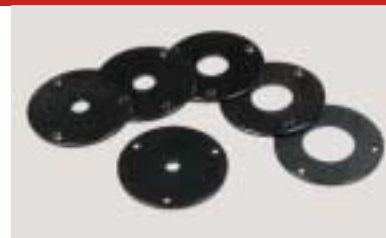
Einsatzscheiben für Ringlunette insert discs for steady jeu de bagues pour lunette ronde