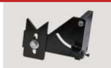
Einlegehilfe für Ringlunette feeding device for steady dispositif d'amenée pour lunette ronde