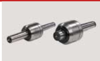
mitlaufende Körnerspitze Live center Pointe tournante de copiage