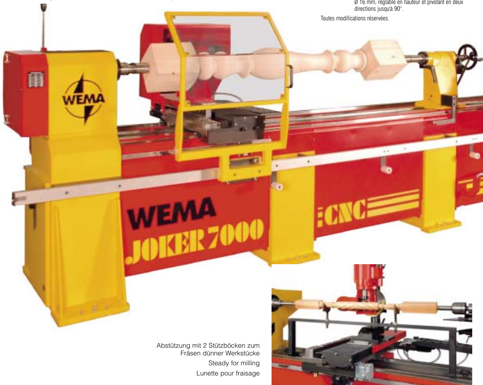
Abstützung mit 2 Stützböcken zum Fräsen dünner Werkstücke Steady for milling Lunette pour fraisage