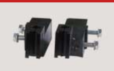
Stahlhalter special toolholder porte-outil